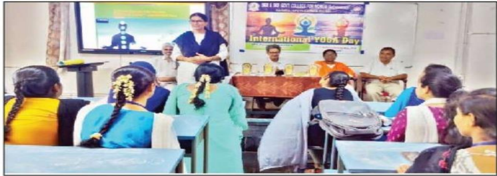
కళాశాలలో యోగా దినోత్సవ కార్యక్రమంలో పాల్గొన్న విద్యార్థిణులు