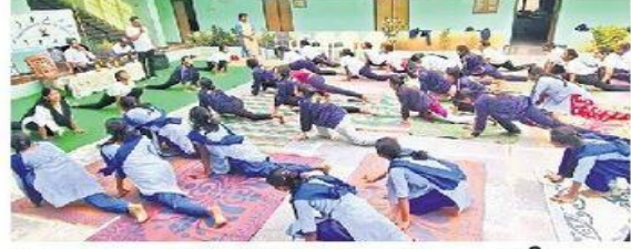
వైబీయూ: ఎస్కేఆర్ ప్రభుత్వ మహిళా డిగ్రీ కళాశాలలో ఆసనాలు వేస్తున్న విద్యార్థినులు

22/06/2024 | YSR Kadapa (Kadapa City) | Page : 11